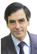
François Fillon, en tant que Premier ministre